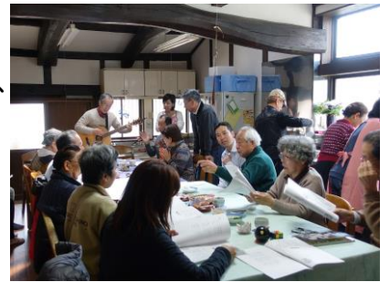
▲牧師さんのギターに合わせて歌う懐メロ

最近使わない部屋を開けたらクモの巣だらけのホコリまみれだった、あるいは建物の痛みに気づけなかったとのお話を聞きます。建物を良い状態で保存するためには戸を締め切るのではなく、開ける回数を増やして風通しを良くすることが大切です。建物の文化的な価値や魅力を引き出すためには所有者以外の人も出入りをして活用していく「風通しの良さ」が大切と改めて感じました。