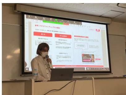
▲廣安氏によるクラファンの仕組みの解説