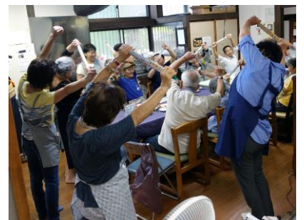
▲いきいき支援センターさんによる手ぬぐい体操