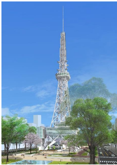
リニューアル 完成予想図