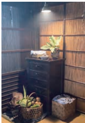
ナカノマの棚。煙で乱反射した光が美しい

戸を新たに設けるなど、大掛かりな修復プロジェクトは数年に渡って行われ、工事は今も継続されています。