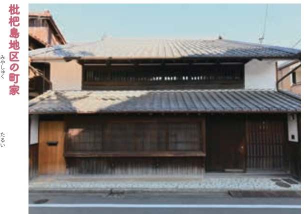
外観をみる。出格子は改修時のもの