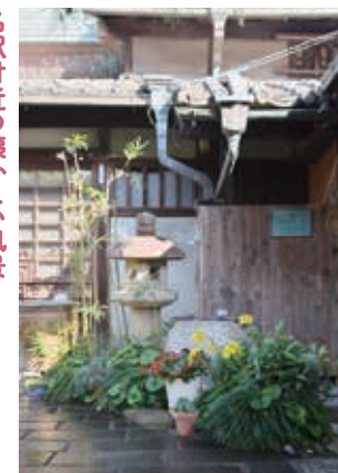
露地の眺め。季節の花々が出迎える