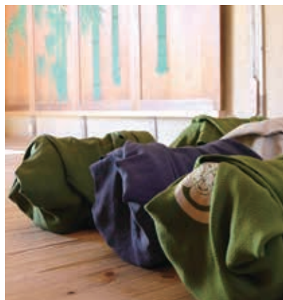
鼓の置かれたお稽古場の風景

寛家住宅のもうひとつの特徴は、地域に開かれていることです。お稽古場では隔週の土曜日に子ども能楽教室が開かれ、伝統文化の