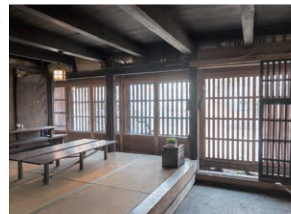
土間の横のミセとオクミセを見る