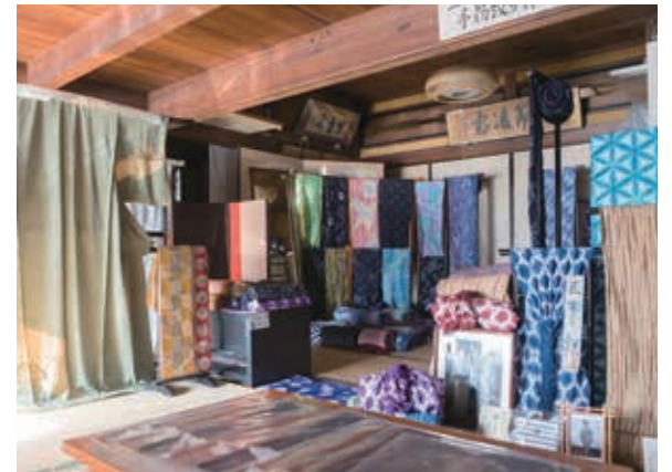
ミセに陳列された有松絞りの品々