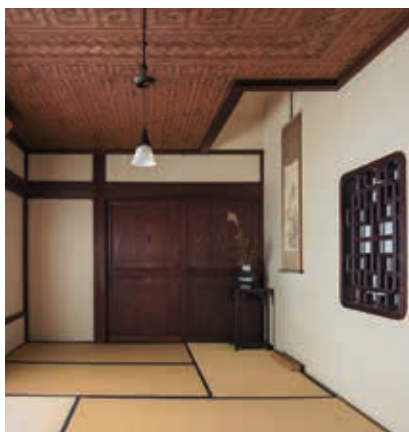
瀟洒な意匠が美しい煎茶室

しかし、身体の調子を崩して40代で隠居すると、以降は数寄の世界に耽溺していきます。