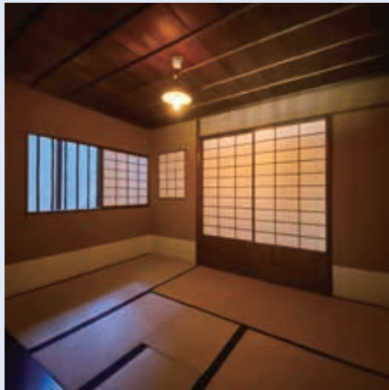
東松家住宅2階の茶室。吹き抜けの青い光が良い

にあった東松家住宅にも2階に茶室があり、名古屋の町家ではこのような茶室が多くつくられていましたが、戦災を受け現在ではほとんど残されていません。 最後に、小栗家住宅の興味深い茶事をご紹介しましょう。情報科学を専門とするご当主の趣向で、床の間にプロジェクトションマッピングを応用した茶席が催されました。 茶室は、軽やかに移築され、一方で伝統を受け継ぎ、またプロジェクトションマッピングなど新しい趣向にも対応できる、幅広い魅力を持った建物なのです。