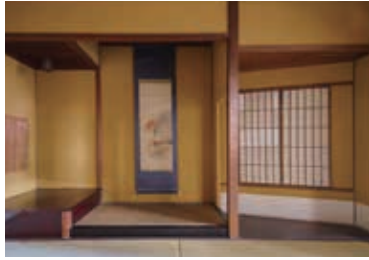
ザシキの奥にある茶室。上客を招いた

一方、上客は裏手の立派な住宅門から招かれ、枯山水の庭を通って茶室へ入り、お茶を楽しんでから商談したといえます。