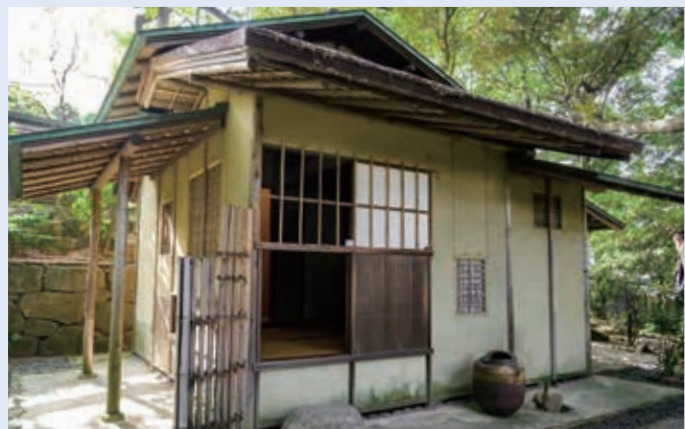
為三郎記念館の知足庵。如庵に倣っている

に写り、時間を忘れて見入ってしまいます。如庵は、灰のひと粒にまでこだわる茶の湯の深奥を垣間見ることができると名建築です。 登録文化財の茶室たち 名古屋市のみならず、そんな如庵に倣った知足庵という茶室があり、ふたつを比較することで昭和の茶人がどのように本家を