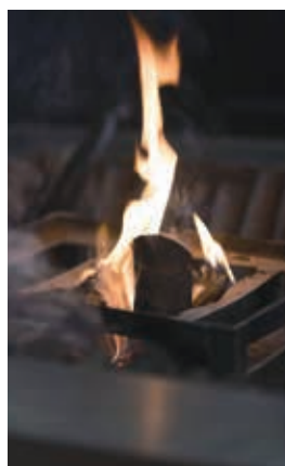
囲炉裏の炎。思わず引き込まれる

ご夫妻は空調設備のない環境で、朝起きると散歩に出掛け、昼は時を割り、日が沈むと本を読んで床に就くような暮らしを送っています。一方では、近所のコンビニも良く利用し、町中の古民家で上手にスローライフを満喫しています。