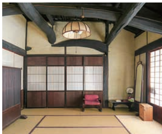
以前は囲炉裏があった客間

夜の帳が下りた庭を足元の明かりを頼りに歩く露地は、ひとときわ美しく感じられます。上空には煌々と明かりが輝く超高層ビル群が伸び上がる、他にはない風景です。