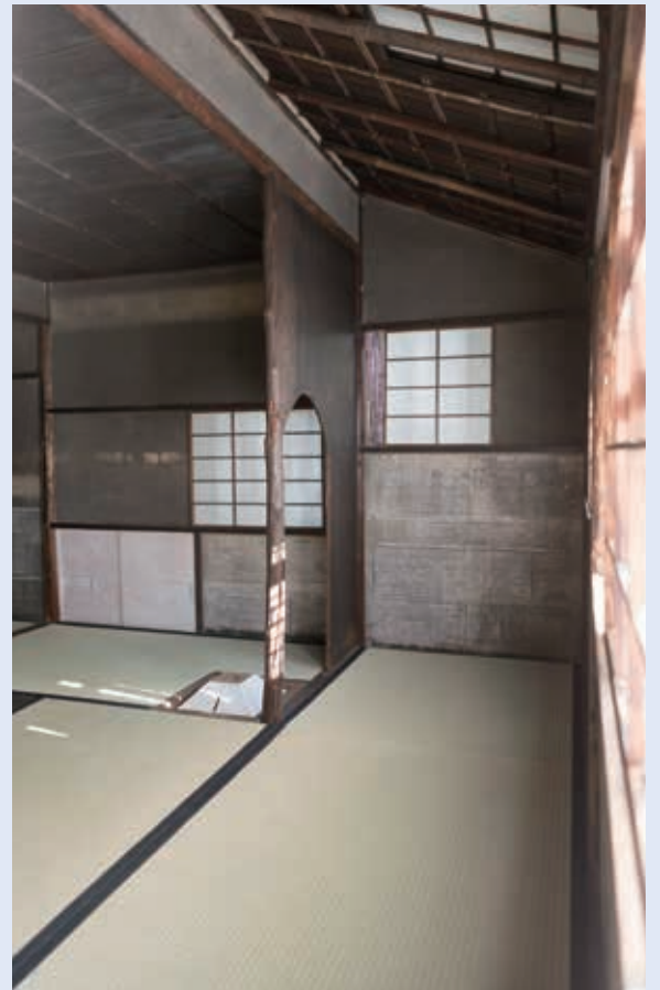
如庵の室内。普段は非公開だが窓から内部を覗きこめる

中に入ると、ほぼ四畳半のとても狭い空間に畳が3枚半敷かれ、正面には床の間があります。炉の切られた点前座を除けば、わずかに2畳半の空間に、赤味がかった床柱の鋭い造形や、伊勢暦の張られた腰壁、艶やかな板壁と中柱など、溢れんばかりの創意工夫が施され、それでいて各々が見事に調和しています。これらは畳に座ることにより鮮明に目