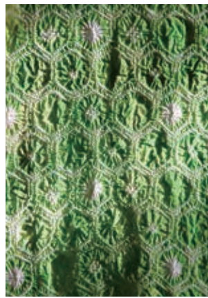
有松絞りの生地。日焼け防止に裏側を展示

そんな有松絞りが存続し再評価されていた背景には、美しい町並みが保存されていたことも欠かせません。伝統的な町並みと技術は車の両輪のように関わり合い、未だ見ぬ価値を秘めているのです。