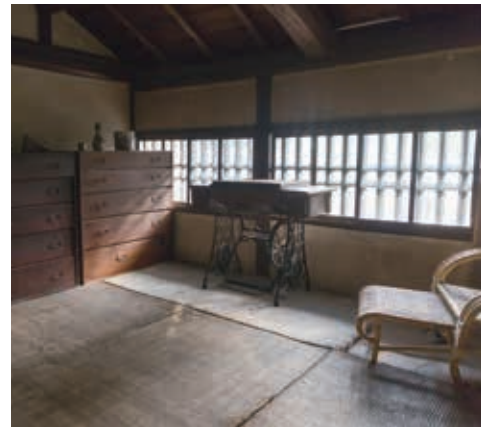
ツシ内部の風景。古道具に光があたって美しい