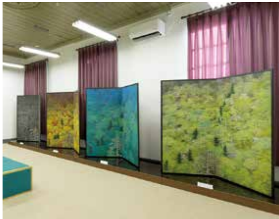
名物企画の平松礼二展覧会

司令部は木造2階建てで、中央にペディメントの載る玄関がつき、白いペンキの塗られたド