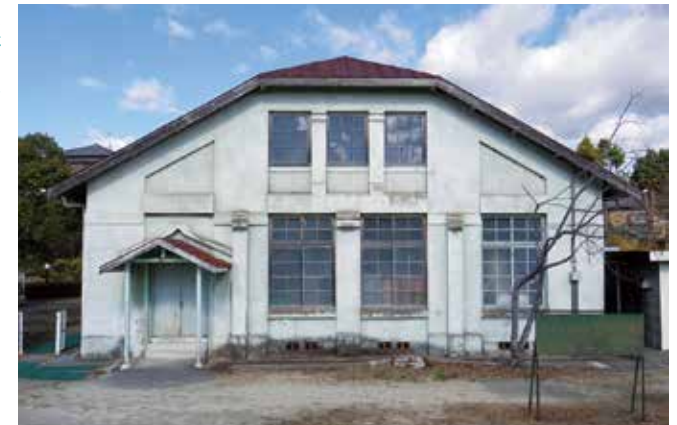
セセッション風の外観

架構の美 構造はぶつう、建物を支える裏方的な存在ですが、時に空間の主役となる場合があります。旧愛知県岡崎師範学校武道場は、木組みと鋼材の張り巡らされたトラスの架構が主役の建物です。