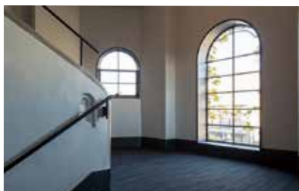
側面の階段塔。手すり壁の造形が面白い

夕暮れ時、キャンパスの目の前まで迫る住宅地の中で、夕日を浴びて立ち尽くす校舎の姿は、思わず見惚れる美しさです。