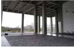
ヒロティからキャンパスを見る

設計は若干30歳の建築家槇文彦。当時の日本建築界では丹下健三を中心に優秀な建築家が登場し、世界中から注目を集めていました。槇はアメリカでアーバンデザインを学んだ経験と、同世代が旗揚げした建築運動メタボリズムを横目