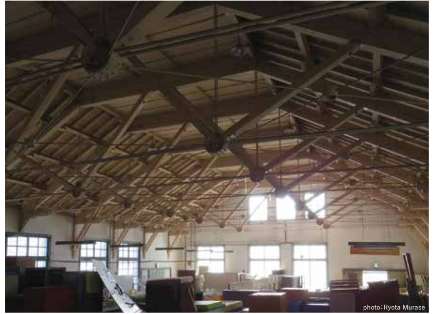
道場内観。窓から差し込む光で混構造のトラスが美しく浮かび上がる