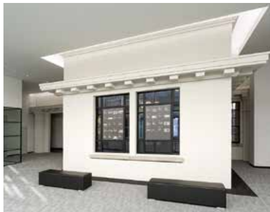
2階のホール。軒のある部分が以前の外壁

正面の幅は72メートル。中央には玄関ポーチが付き、その上にペディメントをかたどった壁が立ち上がります。また両端を突き出し