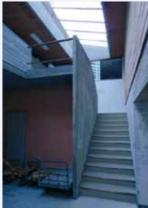
光が落ちる美しいシーン

吉村もレーモンドと同じく、土地造成を最低限に留めて、植栽に力を注ぎました。完成から50年以上が経ってキャンパスは緑に覆われ、学生たちは穏やかな空気の流れる構内で日々創作活動に打ち込んでいます。