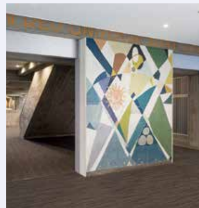
改装された校舎。壁画はレーモンドのデザイン