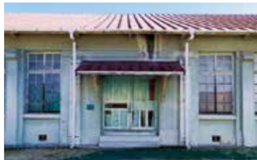
本来の正面入り口

この小屋組みは鉄筋コンクリート造の施工技術の揺籃期のもので、屋根架構が木造トラスと鋼材を合わせた混構造でつくられたことは、今では貴重な見どころとなっています。