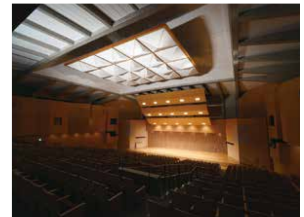
講堂内部。天井のシェルに注目