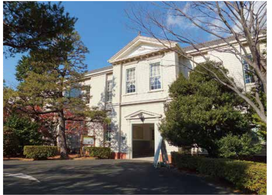
緑に囲まれた記念館。白いドイツ下見板の外観が目目を惹く