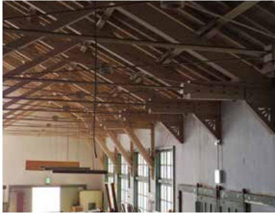
壁と木組みのディテール

愛知県では明治6年に愛知県養成学校が設置され、それを第一として、同32年に岡崎に第二師範学校がおかれました。明治35年に現