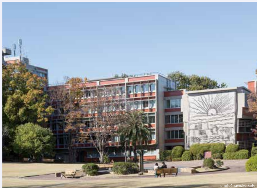
南山大学のキャンパス。コンクリート打ち放しと赤土色のデザインで統一された校舎が美しい